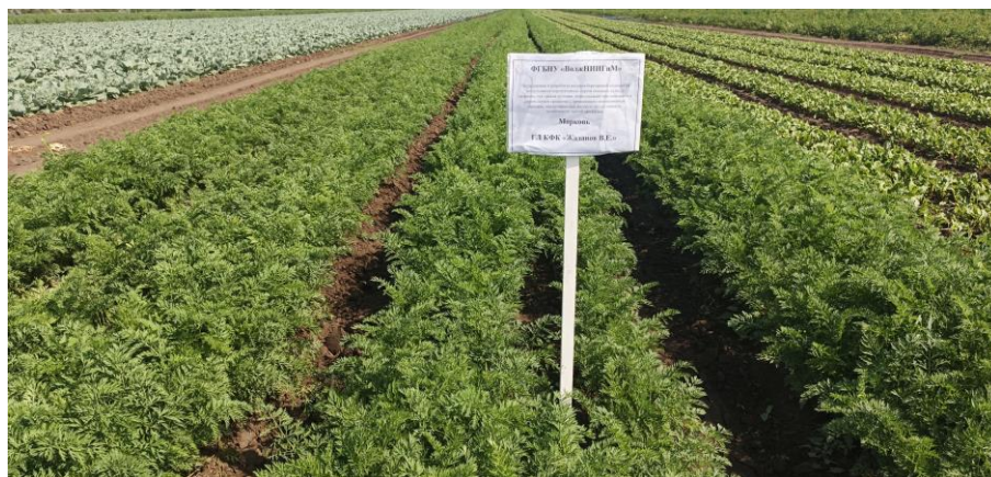
Рисунок 1 – Полевой опыт по возделыванию моркови в КФХ «Жаданов В.»

Исследования по возделыванию овощных культур при капельном и спринклерном орошении проводились в сухостепном Поволжье на экспериментальных участках овощеводческих хозяйств Энгельсского района Саратовской области (рисунки 1 и 2).