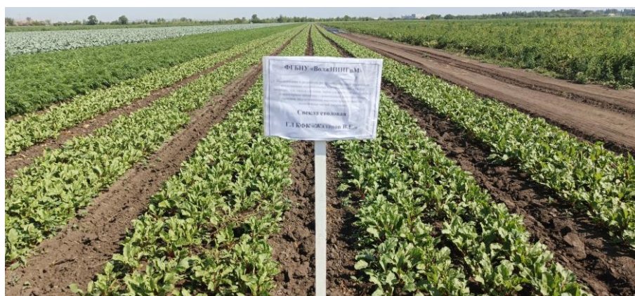
Рисунок 2 – Полевой опыт по возделыванию свеклы столовой в КФХ «Жаданов В.»